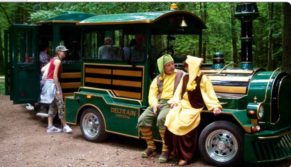
Pasaku bānītis aizvedīs uz Rūķu un Pasaku mežu, pietās bērnu rotaļu laukumā.